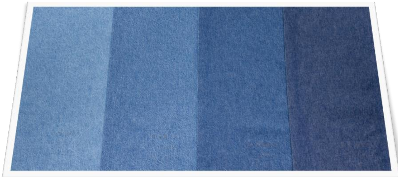
DESTROYER CLARO / SUPER STONE MÉDIO / STONE / AMACIADO