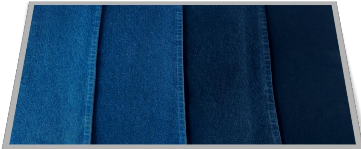
DESTROYER CLARO / SUPER STONE MÉDIO / STONE / AMACIADO