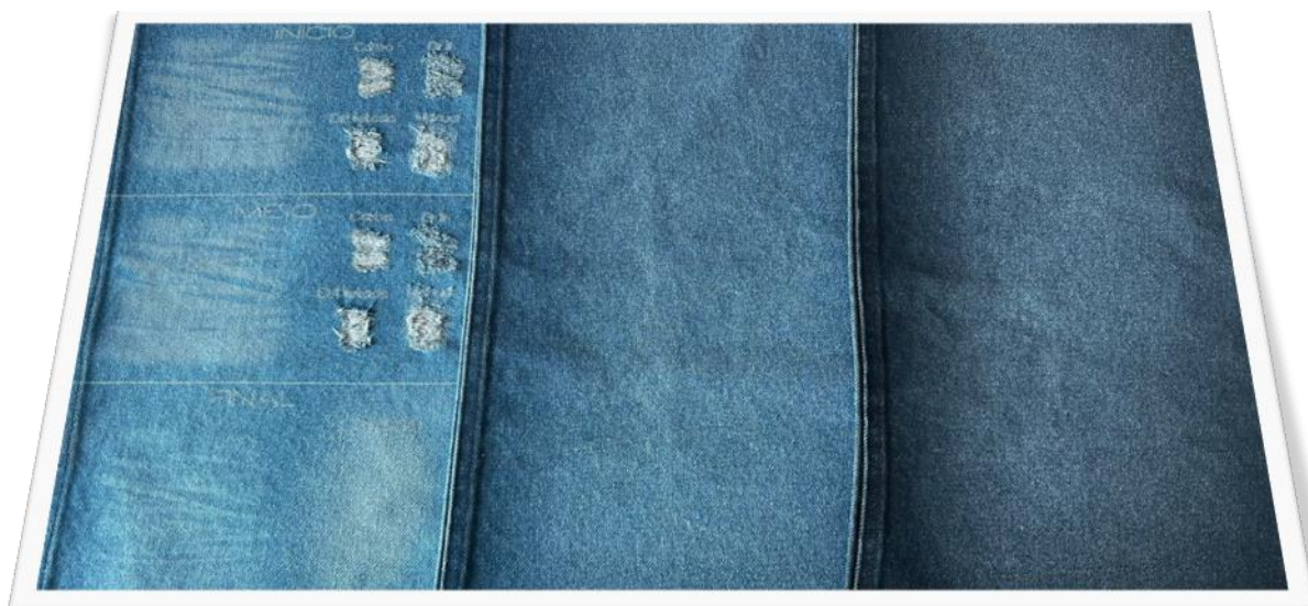
AMOSTRAS COM USED (JATEADO)