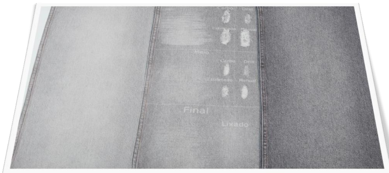
AMOSTRAS COM USED (JATEADO)